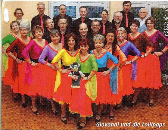
Giovanni und die Lollipopps

(ij) Weil sich vor 45 Jahren bei einigen Paaren nach einem besuchten Grundkurs das Tanzen zu einer Leidenschaft entwickelte, kann der Club der Tanzfreunde Zeven e.V. am 8. Mai einen Jubiläumsball feiern. Denn am 26. Februar 1966 kam es zu einer Versammlung im Gasthaus Sreckels, auf der 56 Mitglieder die Gründung eines Tanzclubs beschlossen, der bis zum heutigen Tag eine feste Größe in der Region ist.